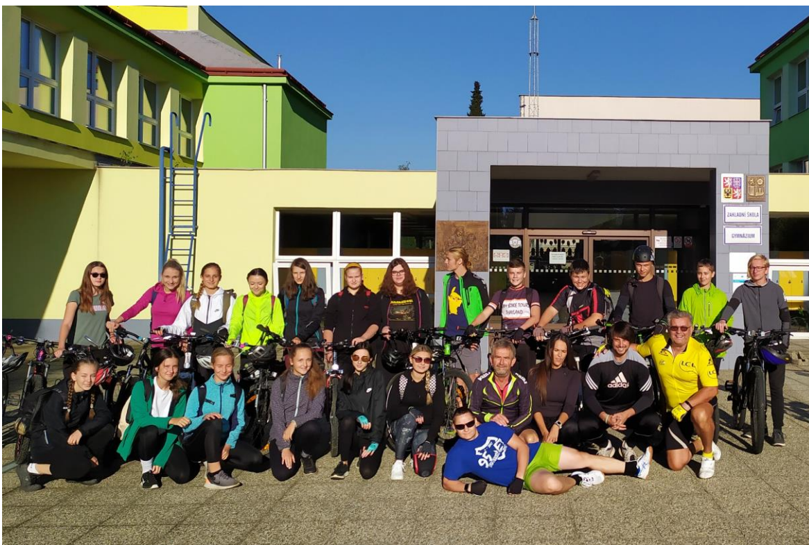
Obrázek 1: 1. ročník před odjezdem na adaptační pobyt do Radíkova

Gymnázium Dačice je střední škola zřízená Jihočeským krajem. Poskytuje všeobecně zaměřené vzdělání ukončené maturitní zkouškou. Nabízí studium ve čtyřletém i osmiletém oboru v denní formě pro žáky z mikroregionu Dačicko i z okrajových částí Jindřichohradecka a Kraje Vysočina. Přibližně dvě třetiny žáků do školy dojíždí. Výuka probíhá dle RVP G a ŠVP s názvem „Komplexní škola I“ (prima–kvarta) a „Komplexní škola II“ (kvinta–oktáva, 1.–4. ročník). Celkový počet 247 žáků (stav k 30. 9. 2020) ve dvanácti třídách a řada společných aktivit mimo vyučování vytváří předpoklady pro individuální přístup k žákům na základě poznání jejich osobnosti, což významným způsobem přispívá k utváření pozitivních vztahů učitelů a žáků a k budování příznivého klimatu školy.