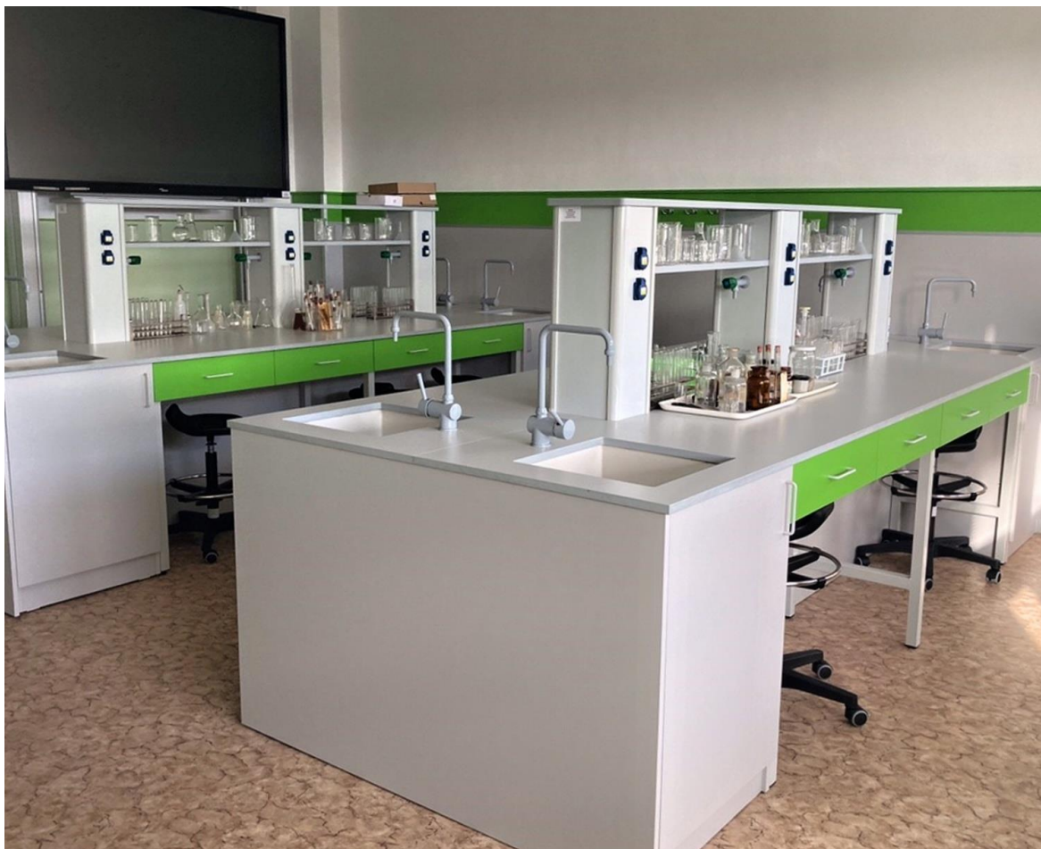
Obrázek 2: Nová laboratoř biologie a chemie

Od září 2020 školního roku 2020/2021 je v provozu nová laboratoř biologie a chemie. Stavební práce financoval vlastník budovy, Město Dačice. Vybavení laboratoře bylo hrazeno z Integrovaného regionálního operačního programu (7. výzva MAS Česká Kanada – IROP – Infrastruktura středních škol a vyšších odborných škol) za finanční spoluúčasti zřizovatele školy Jihočeského kraje. Nová laboratoř je určena především pro výuku přírodovědného praktika a laboratorní techniky. V laboratoři je šestnáct pracovních míst pro žáky, kteří zde budou moci sami provádět různé experimenty, sestavovat aparatury, mikroskopovat, pracovat s měřícím systémem Pasco apod. Vyučující má v laboratoři k dispozici počítač, vizualizér i interaktivní dotykový panel a novou moderní digestoř, která je velkým přínosem pro provádění především demonstračních pokusů.