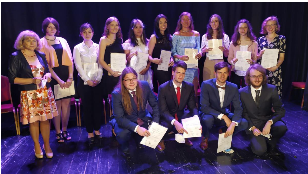
Obrázek 3: Oktáva po slavnostním předávání maturitních vysvědčení

Slavnostní předávání maturitních vysvědčení proběhlo v pátek 11. června 2021 v KD Beseda v Dačicích za účasti představitelů města, pedagogického sboru školy a především rodičů, prarodičů a přátel letošních absolventů.