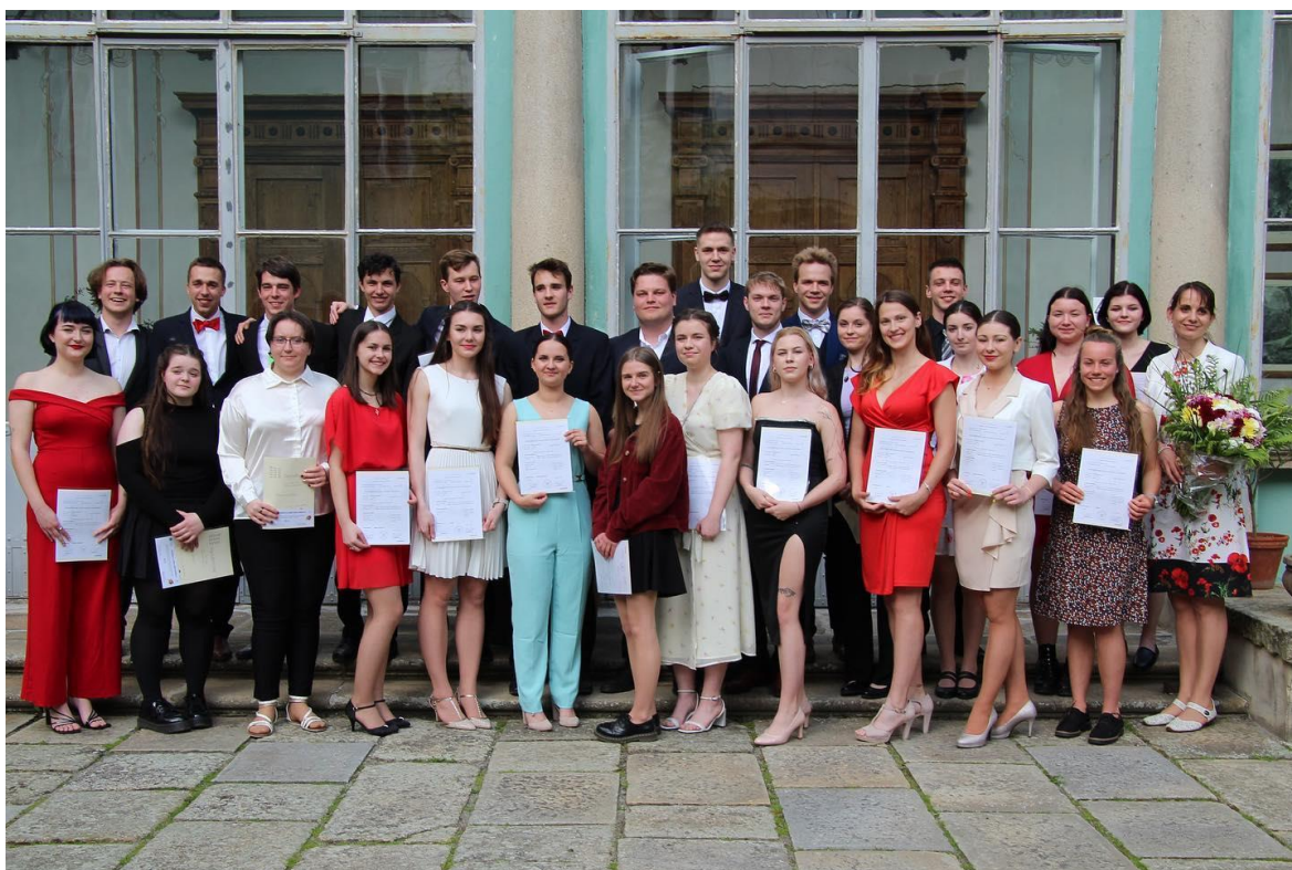
Obrázek 3: Oktáva po slavnostním předávání maturitních vysvědčení

Slavnostní předávání maturitních vysvědčení proběhlo v pátek 26. května 2023 na nádvoří Státního zámku v Dačicích za účasti představitelů města, pedagogického sboru školy a především rodičů, prarodičů a přátel letošních absolventů.