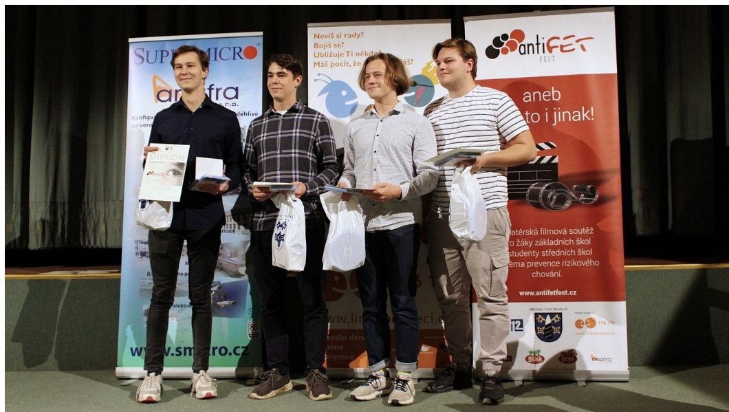
Obrázek 5: Vítežové AntifetFestu 2022 v kategorii středních škol