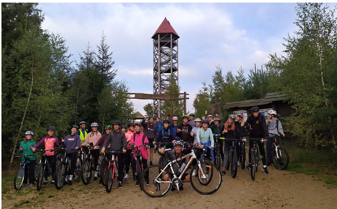
Obrázek 2: Adaptační pobyt 1. ročníku

Celkem dvanáct tříd s průměrným počtem dvacet dva studentů a řada společných aktivit mimo vyučování vytvářejí předpoklady pro individuální přístup k žákům na základě poznání jejich osobnosti, což významným způsobem přispívá k utváření pozitivních vztahů učitelů a žáků a k budování příznivého klimatu školy.