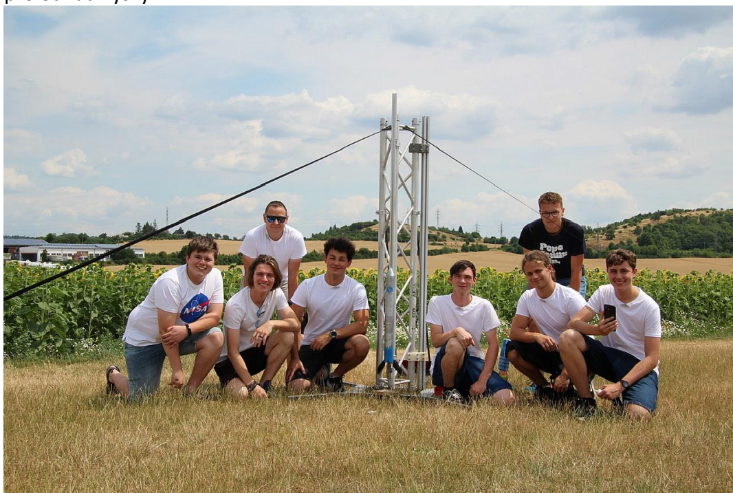
Obrázek 4: Space XD připravena ke startu za vítězství na celorepublikovém finále soutěže Czech Rocket Challenge

Czech Rocket Challenge je týmová soutěž určená pro středoškolské i vysokoškolské studenty a je rozdělena na začátečníky a pokročilé. V rámci této výzvy mají týmy za úkol navrhnout, sestavit, otestovat a nakonec odpálit svou raketu. Při závěrečném odpalu se nehodnotí jen dosažená výška, ale i design a komplexnost rakety a smysl pro odhad výšky.