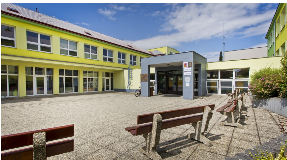
Obrázek 1 – Hlavní vstup do budovy školy

Gymnázium Dačice je střední škola zřízená Jihočeským krajem. Poskytuje všeobecně zaměřené vzdělání ukončené maturitní zkouškou. Nabízí studium ve čtyřletém i osmiletém oboru v denní formě pro žáky z mikroregionu Dačicko i z okrajových částí Jindřichohradecka a Kraje Vysočina. Přibližně dvě třetiny žáků do školy dojíždí. Výuka probíhá dle RVP G a ŠVP s názvem „Komplexní škola I“ (prima–kvarta) a „Komplexní škola II“ (kvinta–oktáva, 1.–4. ročník). Celkový počet 238 žáků ve dvanácti třídách a řada společných aktivit mimo vyučování vytváří předpoklady pro individuální přístup k žákům na základě poznání jejich osobnosti, což významným způsobem přispívá k utváření pozitivních vztahů učitelů a žáků a k budování příznivého klimatu školy.