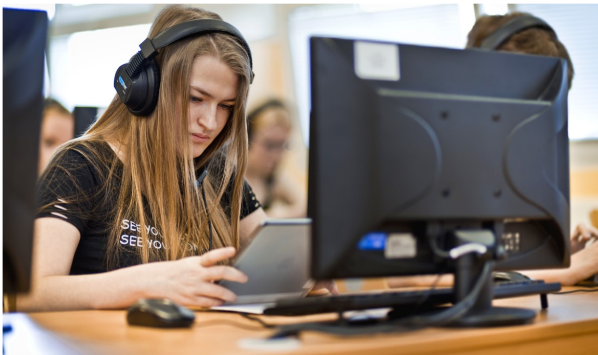
Obrázek 2 – Výuka v nové učebně IVT a cizích jazyků

Oba uvedené obory jsou všeobecně zaměřené. Vedle hlavních oblastí vzdělávání, kterými jsou Jazyk a jazyková komunikace, Matematika a její aplikace, Informační a komunikační technologie, Člověk a příroda a Člověk a společnost, v nich své místo zauímají i oblasti Umění a kultura, Člověk a zdraví a Člověk a svět práce. Určitou míru diferenciací ve vzdělávání umožňuje skupina povinně volitelných předmětů, které jsou zařazovány v kvartě osmiletého oboru (laboratorní technika, digitální technologie), ve druhém a třetím ročníku čtyřletého a v sextě a septimě osmiletého gymnázia (deskriptivní geometrie, konverzace v anglickém jazyce, konverzace v německém jazyce, programování, přírodovědná praktika, ruský jazyk a základy administrativy) a v maturitních třídách, kde se jedná o systém maturitních seminářů pokrývajících prakticky všechny obory společné a profilové části maturitní zkoušky, přičemž konkrétní semináře jsou v daném školním roce vyučovány v případě dostatečného zájmu žáků.