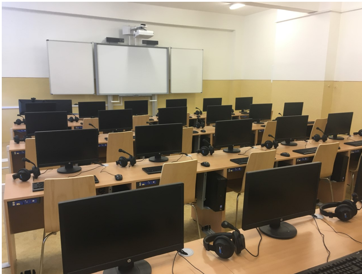
Obrázek 2 – Nová učebna IVT a cizích jazyků

Oba uvedené obory jsou všeobecně zaměřené. Vedle hlavních oblastí vzdělávání, kterými jsou Jazyk a jazyková komunikace, Matematika a její aplikace, Informační a komunikační technologie, Člověk a příroda a Člověk a společnost, v nich své místo zaujímají i oblasti Umění a kultura, Člověk a zdraví a Člověk a svět práce. Určitou míru diferenciací ve vzdělávání umožňuje skupina povinně volitelných předmětů, které jsou zařazovány v kvartě osmiletého oboru (laboratorní technika, digitální technologie), ve druhém a třetím ročníku čtyřletého a sextě a septimě osmiletého gymnázia (deskriptivní geometrie, francouzský jazyk, konverzace v anglickém jazyce, konverzace v německém jazyce, latina, programování, přírodovědná praktika, ruský jazyk a základy administrativy) a v maturitních třídách, kde se jedná o systém maturitních seminářů pokrývajících prakticky všechny obory společné a profilové části maturitní zkoušky, přičemž konkrétní semináře jsou v daném školním roce vyučovány v případě dostatečného zájmu žáků.