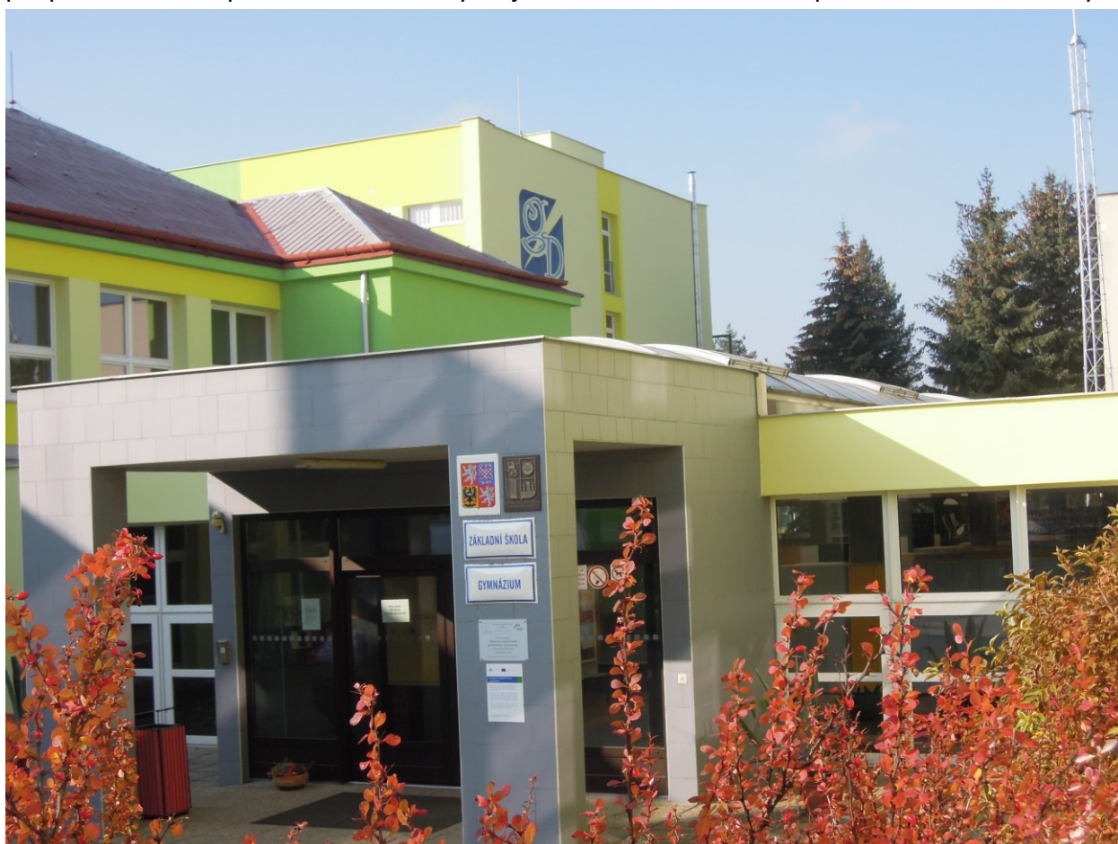
Obrázek 1 – Budova školy

Gymnázium Dačice je střední škola poskytující střední všeobecně zaměřené vzdělání ukončené maturitní zkouškou v osmiletém a čtyřletém oboru vzdělávání. Kapacita školy činí 360 žáků, ve školním roce 2017/2018 byla naplněna ze 71,4 %. Přibližně dvě třetiny žáků do školy dojíždějí. Během více než šedesátileté historie školu opustilo 2 258 úspěšných absolventů, z nichž většina pokračovala v dalším vzdělávání na vysokých školách a na dalších typech škol terciárního vzdělávání, menší část vstoupila bezprostředně po absolvování školy do praxe. Jako hlavní poslání školy v dnešní době vnímáme poskytování kvalitního všeobecně zaměřeného středního vzdělávání žákům po absolvování 5. a 9. třídy základní školy ve spádové oblasti dačického gymnázia, která kromě vlastního mikroregionu Dačicko zahrnuje ještě okrajové části Jindřichohradecka a Kraje Vysočina. Škola vykonává svou činnost v části pavilónového školního areálu v ulici B. Němcové v Dačicích, který vlastní město Dačice. Je moderně zařízena didaktickými pomůckami a její vybavení v oblasti digitálních technologií je nadstandardní. Celkový počet dvanácti tříd a řada společných aktivit mimo vyučování vytváří předpoklady pro individuální přístup k žákům na základě poznání jejich osobnosti, což významným způsobem přispívá k utváření pozitivních vztahů vyučujících a žáků a k budování příznivého klimatu školy.