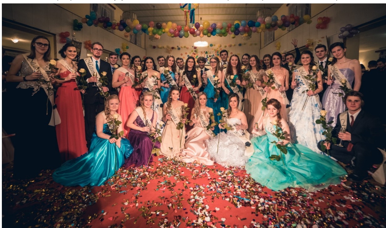
Obrázek 3 – Maturitní ples 4. ročníku

Škola umožnila v několika případech v průběhu školního roku 2017/2018 svým bývalým absolventům při příležitosti jejich setkání návštěvu. Obvykle to bylo v době mimo vyučování.