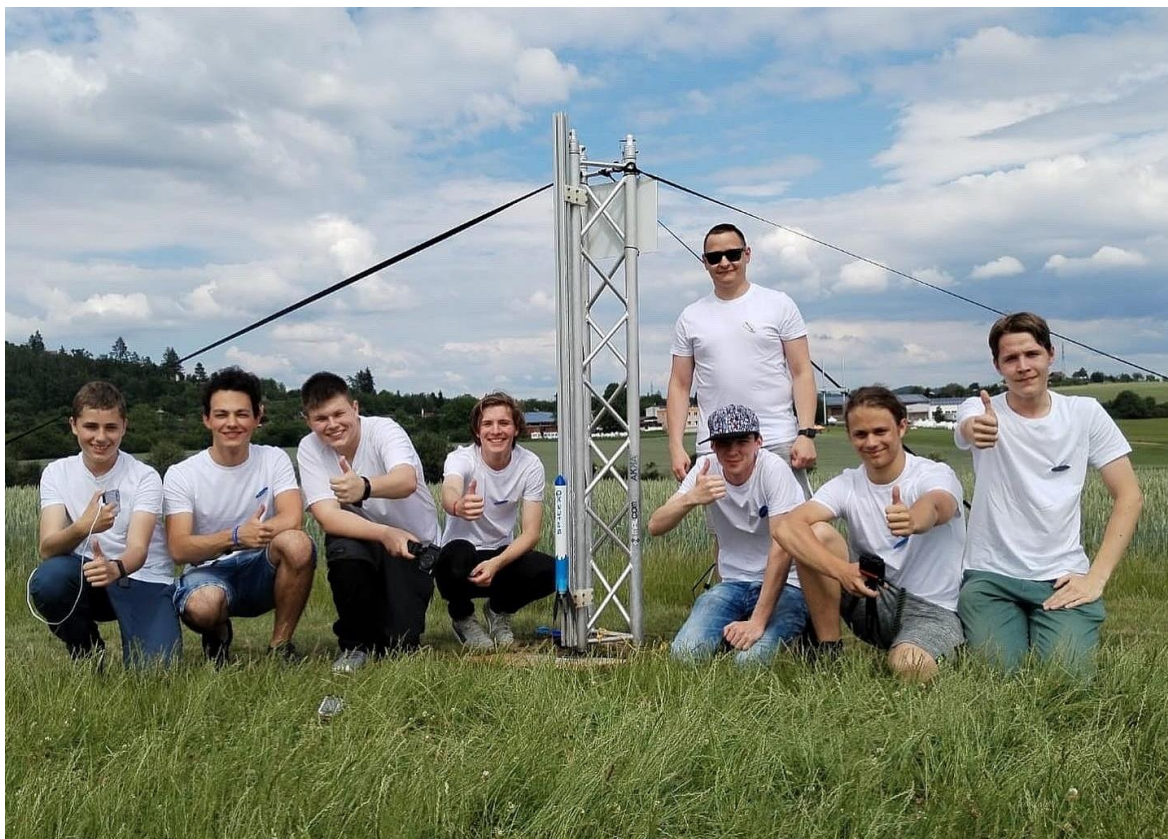
Obrázek 3: Space XD připravena ke startu na celorepublikovém finále soutěže Czech Rocket Challenge.