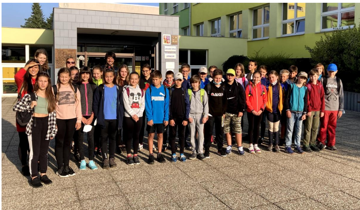
Obrázek 1: Prima před odchodem na adaptační pobyt do Vnorovic

Celkem dvanáct tříd s průměrným počtem dvaceti studentů a řada společných aktivit mimo vyučování vytvářejí předpoklady pro individuální přístup k žákům na základě poznání jejich osobnosti, což významným způsobem přispívá k utváření pozitivních vztahů učitelů a žáků a k budování příznivého klimatu školy.