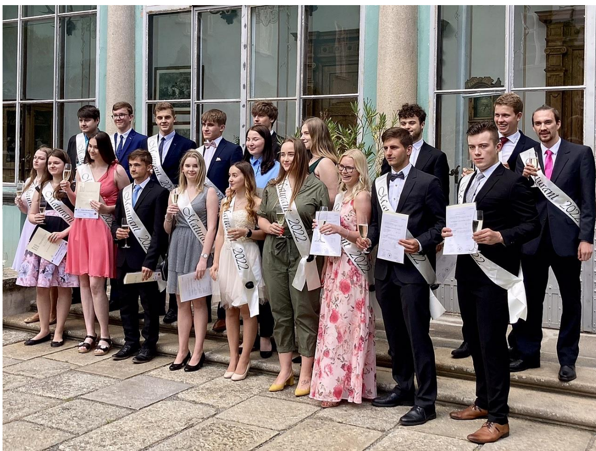
Obrázek 2: 4. ročník po slavnostním předávání maturitních vysvědčení

Slavnostní předávání maturitních vysvědčení proběhlo v pátek 27. května 2022 na nádvoří Státního zámku v Dačicích za účasti představitelů města, pedagogického sboru školy a především rodičů, prarodičů a přátel letošních absolventů.